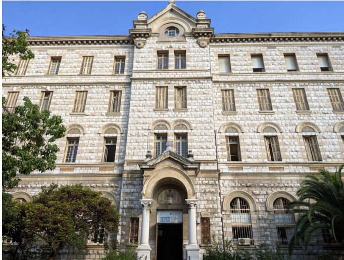
Nice George V