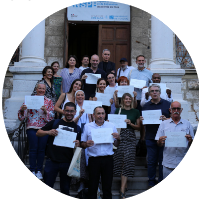
Cérémonie de remise des diplômes

Formation continue : 1000 € selon situation individuelle et financement employeur ou autre organisme